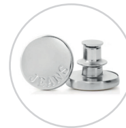
Botões para jeans